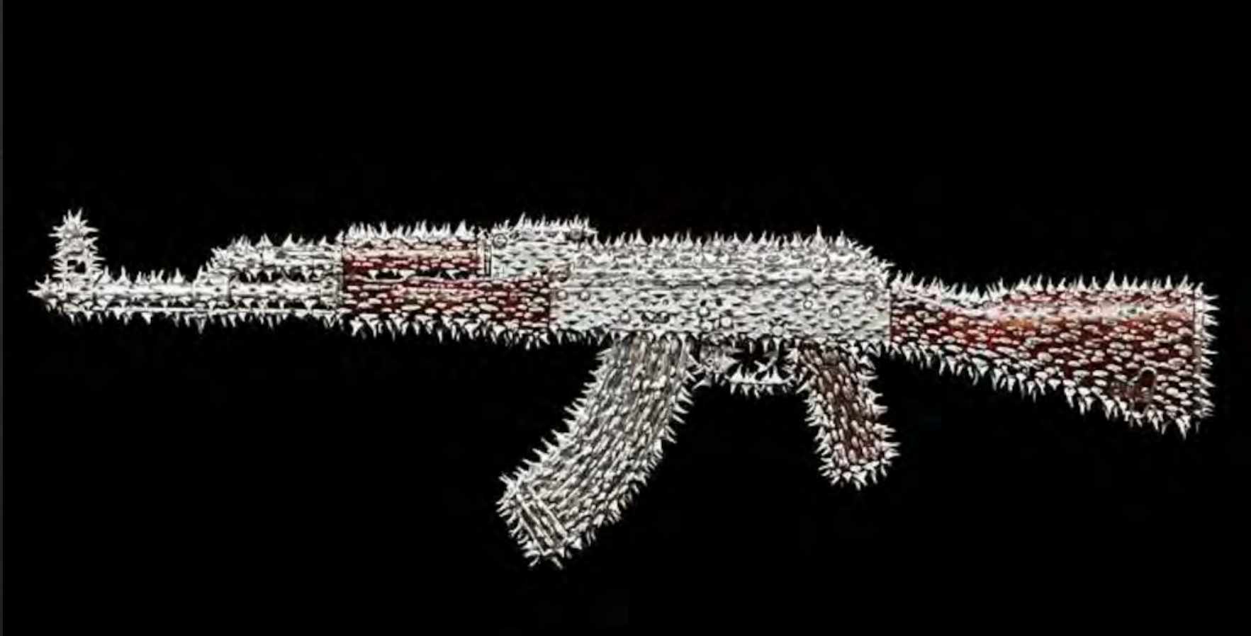
Nancy FOUTS, Don't touch , 2012, 37x90x10 cm, AK47 déclassé, épines de rose