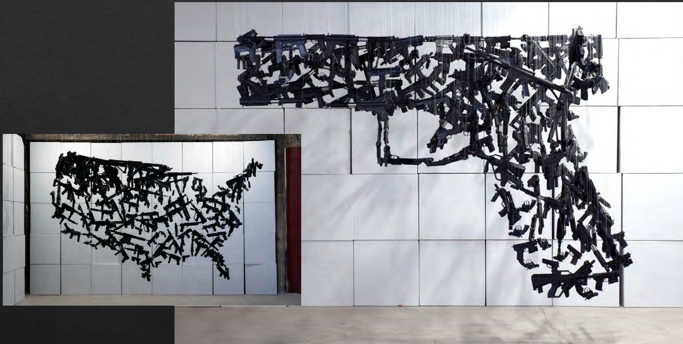
Michel MURPHY, Gun Country , 2014, dimensions variables, 150 armes-jouets