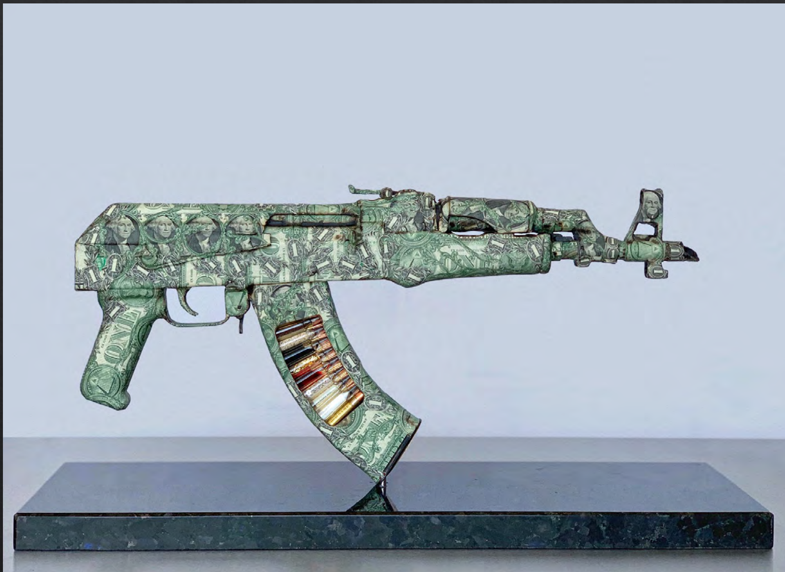
Bran SYMONDSON, AK47, Spoils of War Draco , 2020, 61x29x17 cm, AK47, billets de 1 dollar