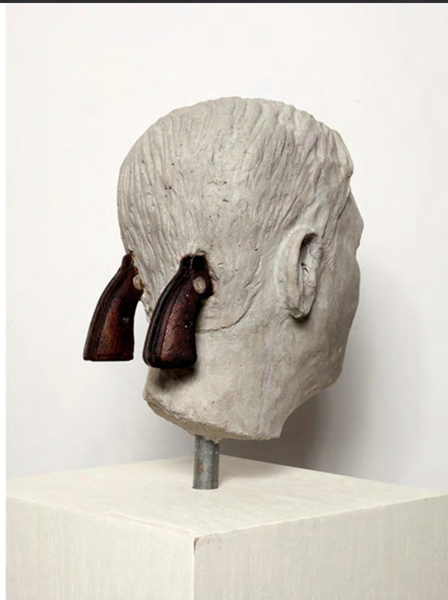
Mel CHIN, Arthur Flegenheimer alias Dutch Schultz , 2014, 30x30x170 cm, Colt cal. 38, béton