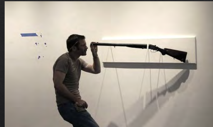
Adam MYSOCK, Looking Down the Barrel of a Gun , 2014, 31x120x53 cm, illustration du Jument dernier, fusil de chasse