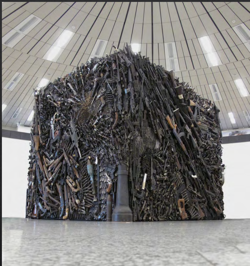
Sandra BROMLEY & Wallis KENDAL, The Gun Sculpture , 2016, assemblage d'env. 7000 armes désactivées