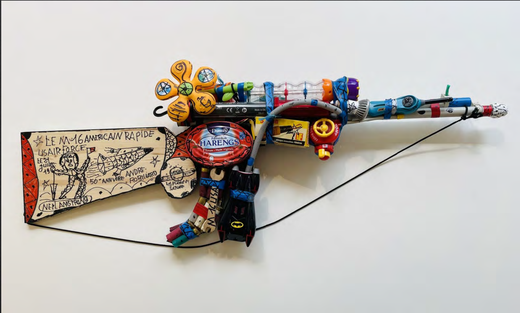
André ROBILLARD, M16 , 1999, 120x47x18 cm, assemblage d'objets et de matériaux divers