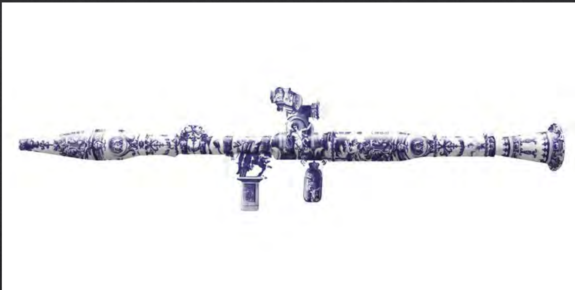
Magnus GJOEN, Delf Rocket Launcher , 2011, 35x125 cm, impression encre sur papier