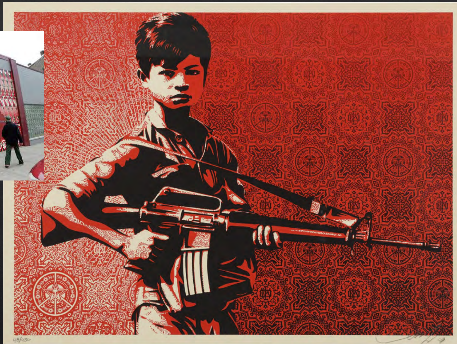
Shepard FAIREY, Child Soldier , 2010, dimensions variables, sérigraphie