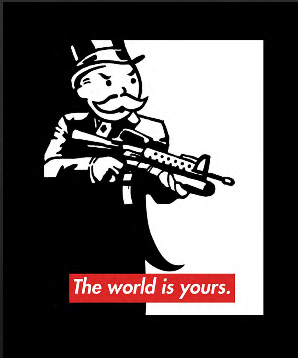
Anonyme, Monopoly Man With Gun , 50x70 cm, poster