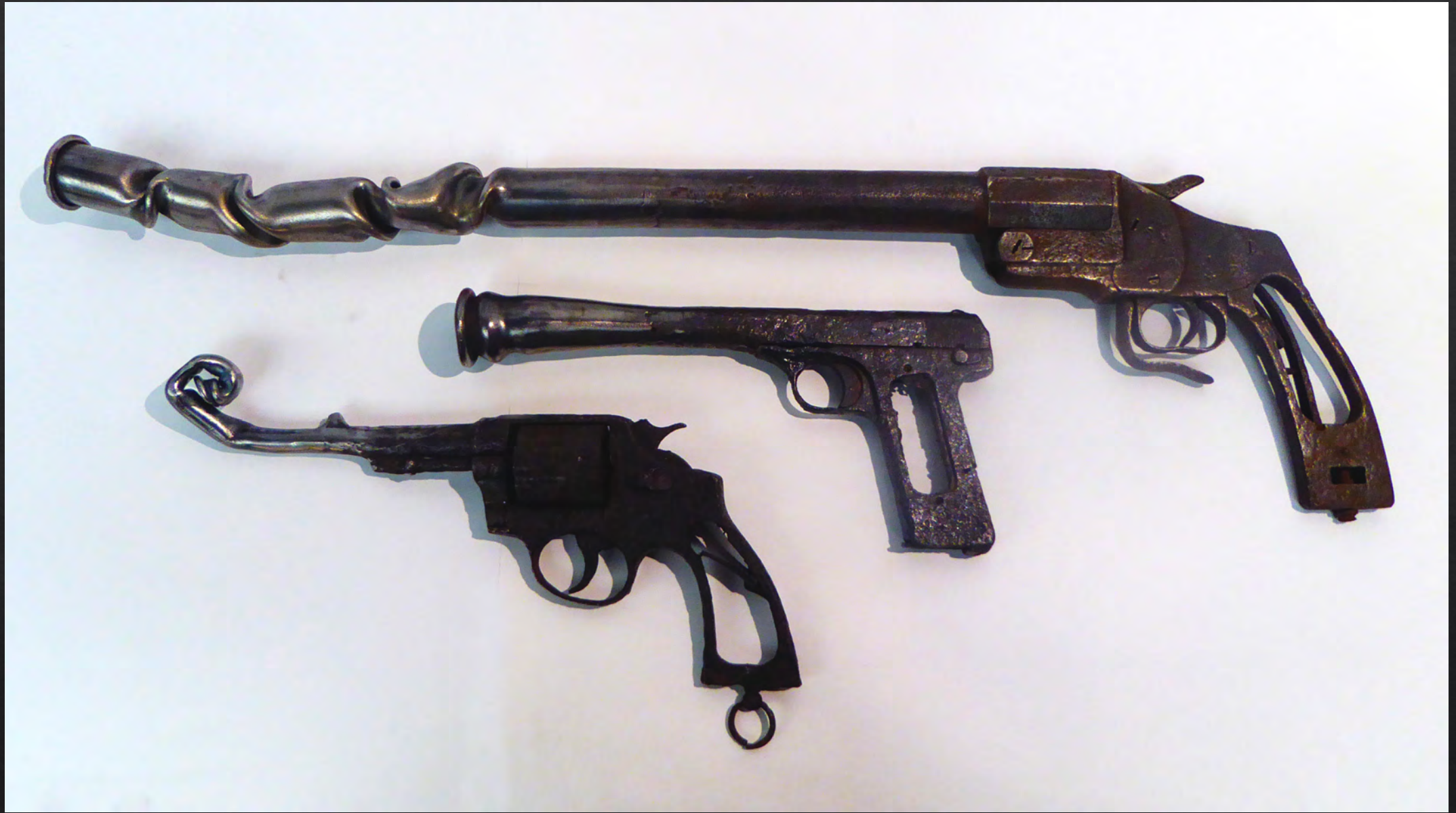
Caroline BRISSET, Guns , 2018, 18x67x4 cm (le plus grand), acier, arme de la 1 ère guerre mondiale