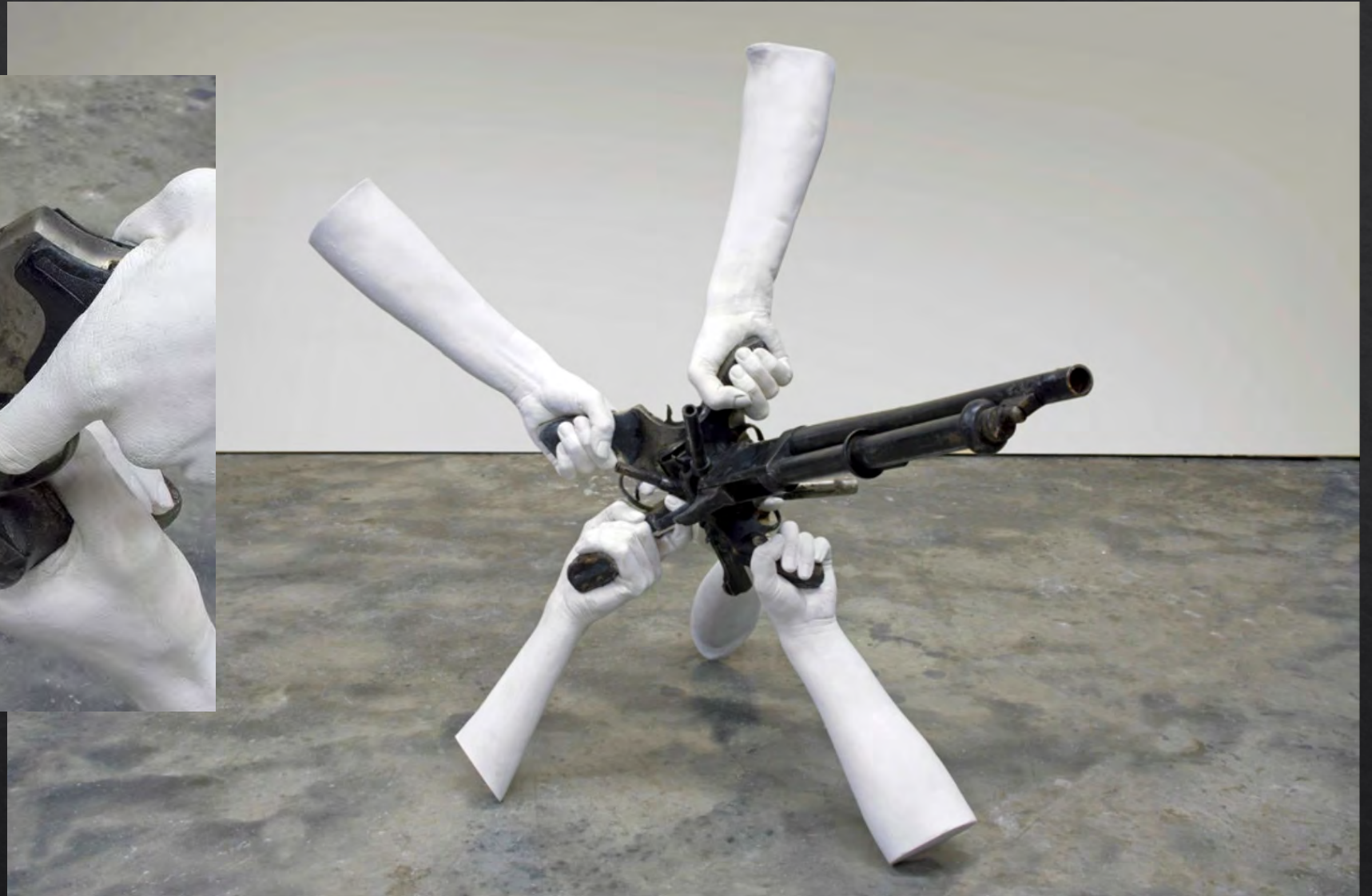
Michel DE BROIN, War of Freedom , 2014, 67x64x66 cm, armes à feu, bronze, matériaux composites