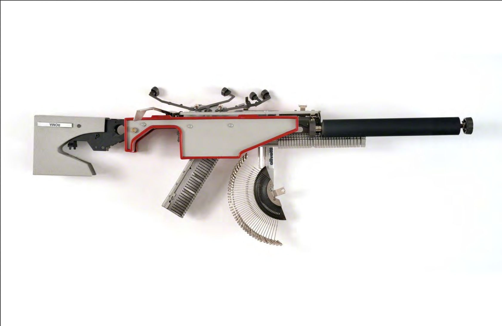
Éric NADO, Olivetti Roma (Typewriter Gun) , 2018, 28x77,5x7,5 cm, machine à écrire