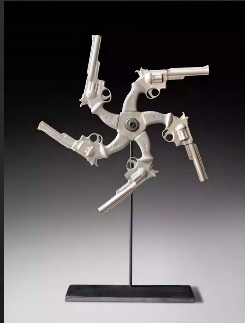
Linda LIGHTON, 44 Magnum Mandala , 2011, 72x49,5x10 cm, porcelaine et acier