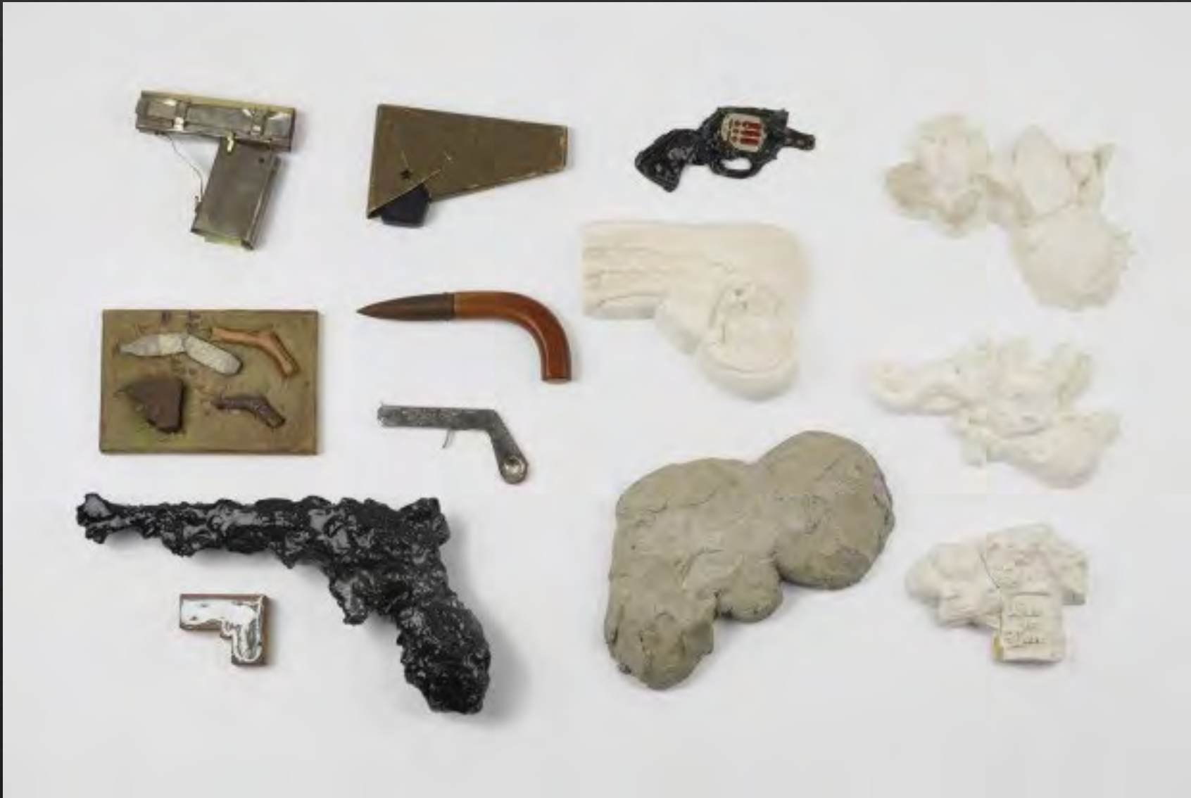
Claes OLDENBURG, Ray Gun Wing , 1969-77, 263x450x565 cm, vitrines avec 258 objets