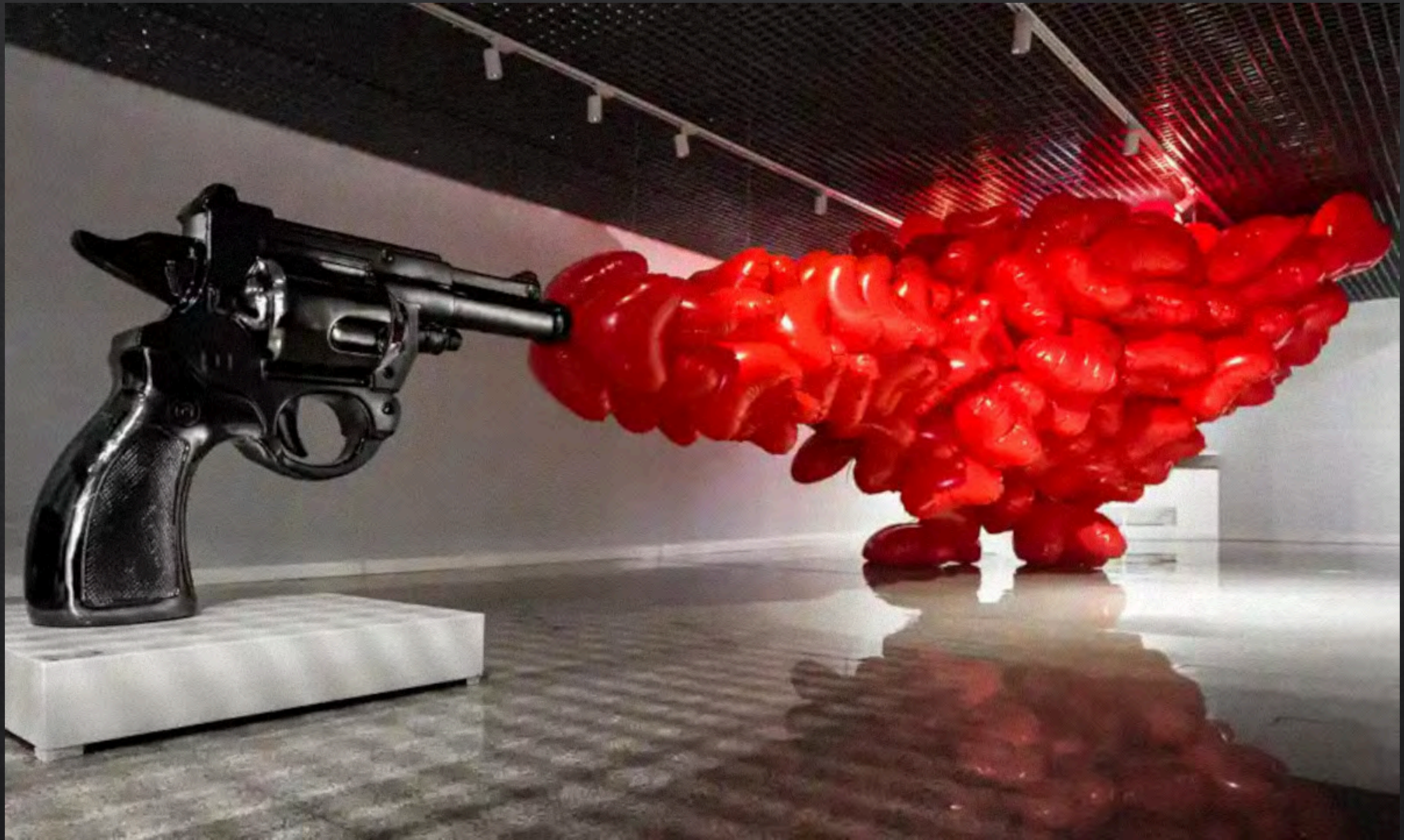
Lee Seung KOO, Compromise Between Me and Me , 2017, dimensions variables, bronze