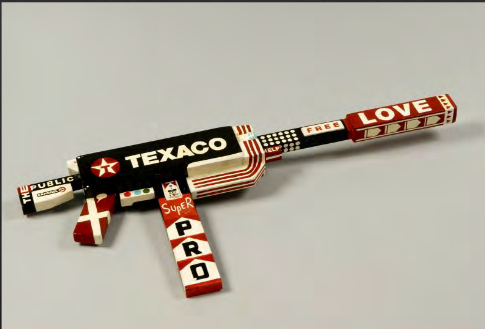
Eliezer SONNENSCHNAIN, Texaco , 2004, 40x120 cm, acrylique sur bois