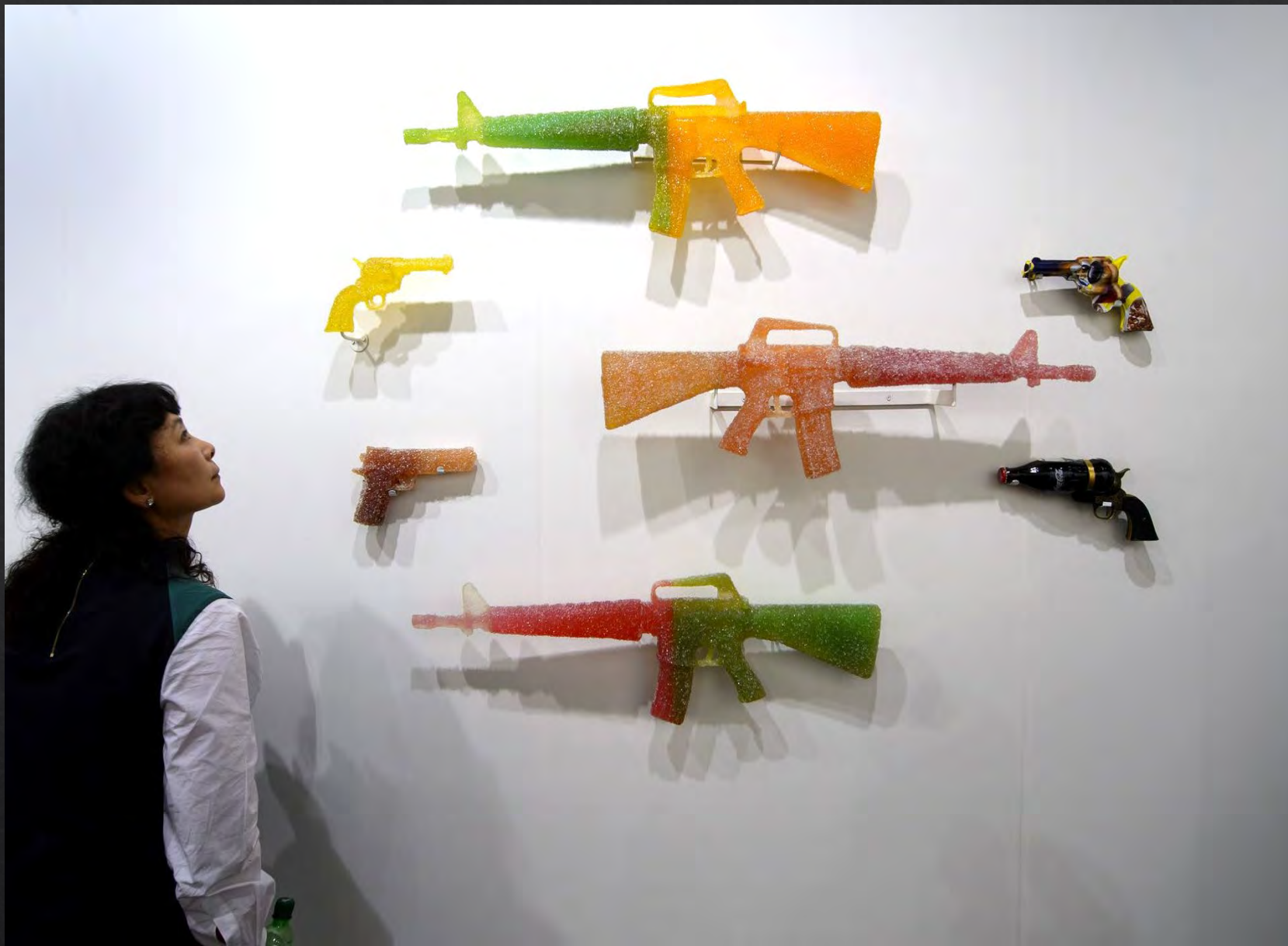
Darren LAGO, Gummy Guns , 2013, résine teintée et granulés de verre