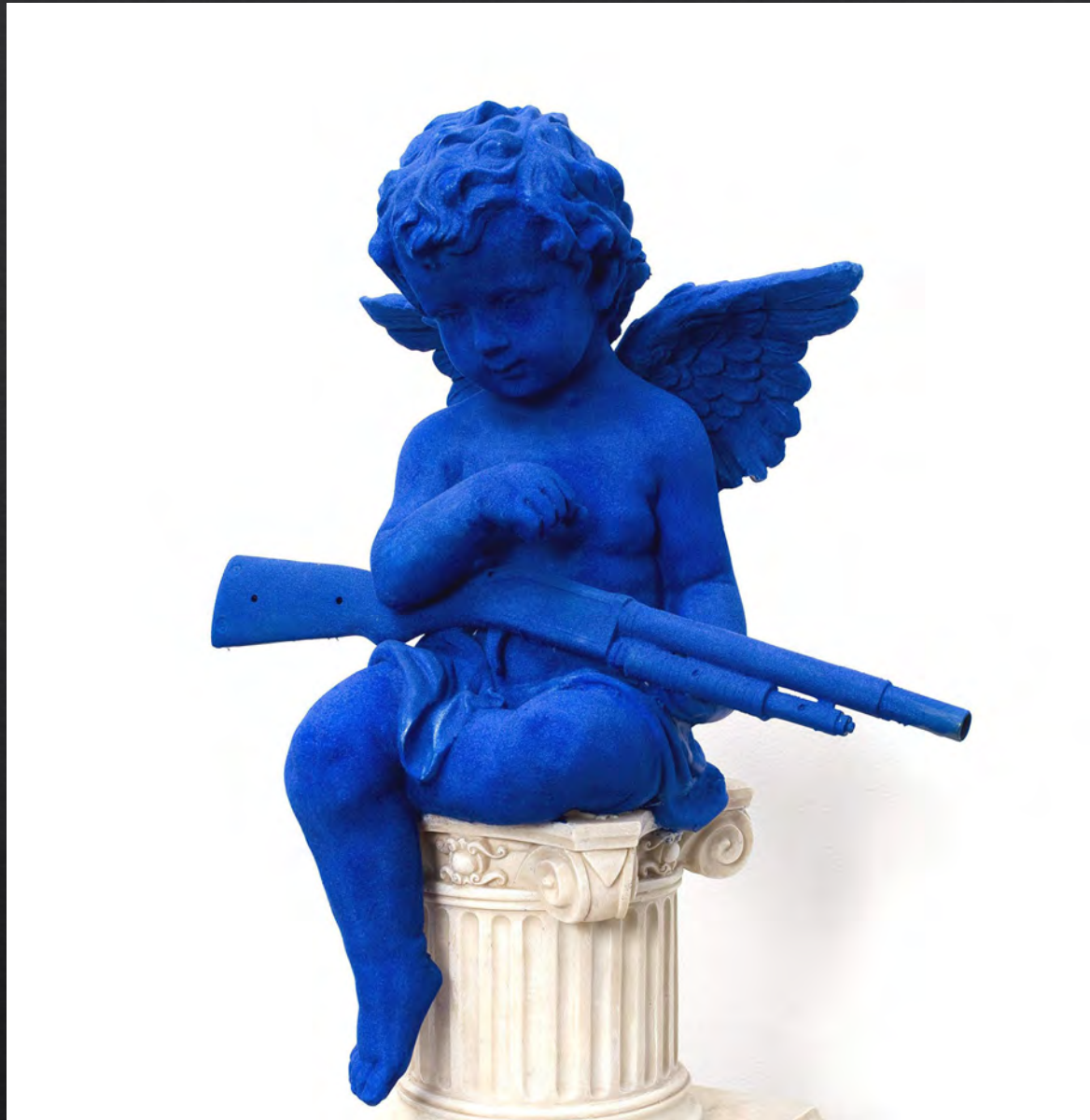
Willie COLLE, Medecine man , 2010, 59x44x28 cm, résine, acrylique, flocage