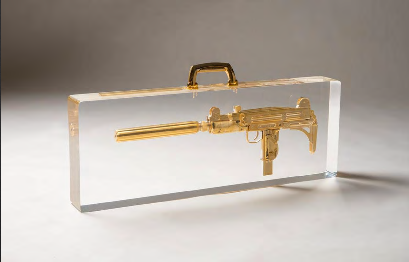
Ted NOTEN, Uzi mon amour , 2009, 83x30x9,5 cm, Uzi plaqué or, résine, poignée en laiton, poème gravé