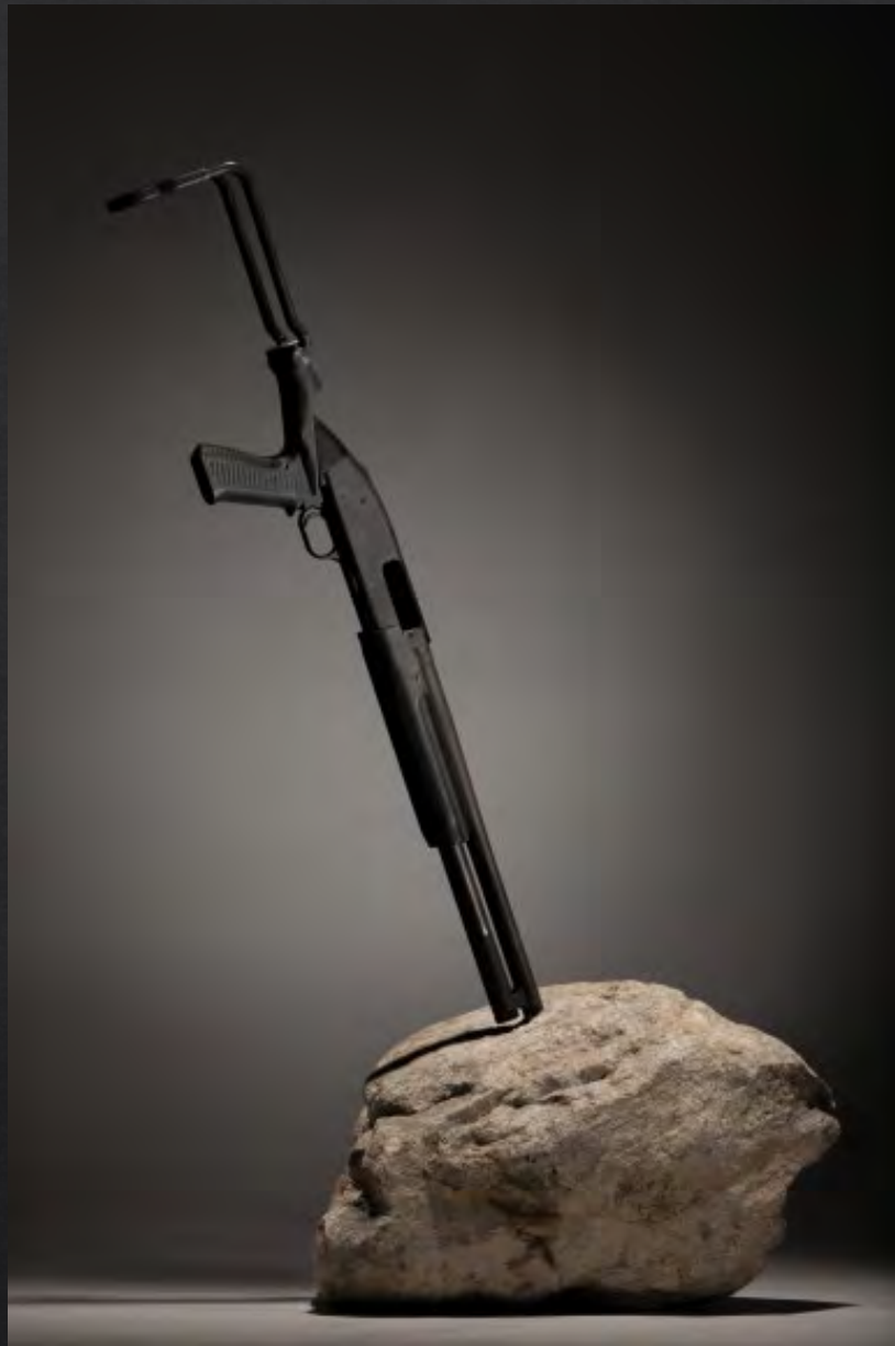
Jonathan FERRARA, Excalibur No More , 2014, 111x76x48 cm, fusil de chasse, rocher (Colorado)