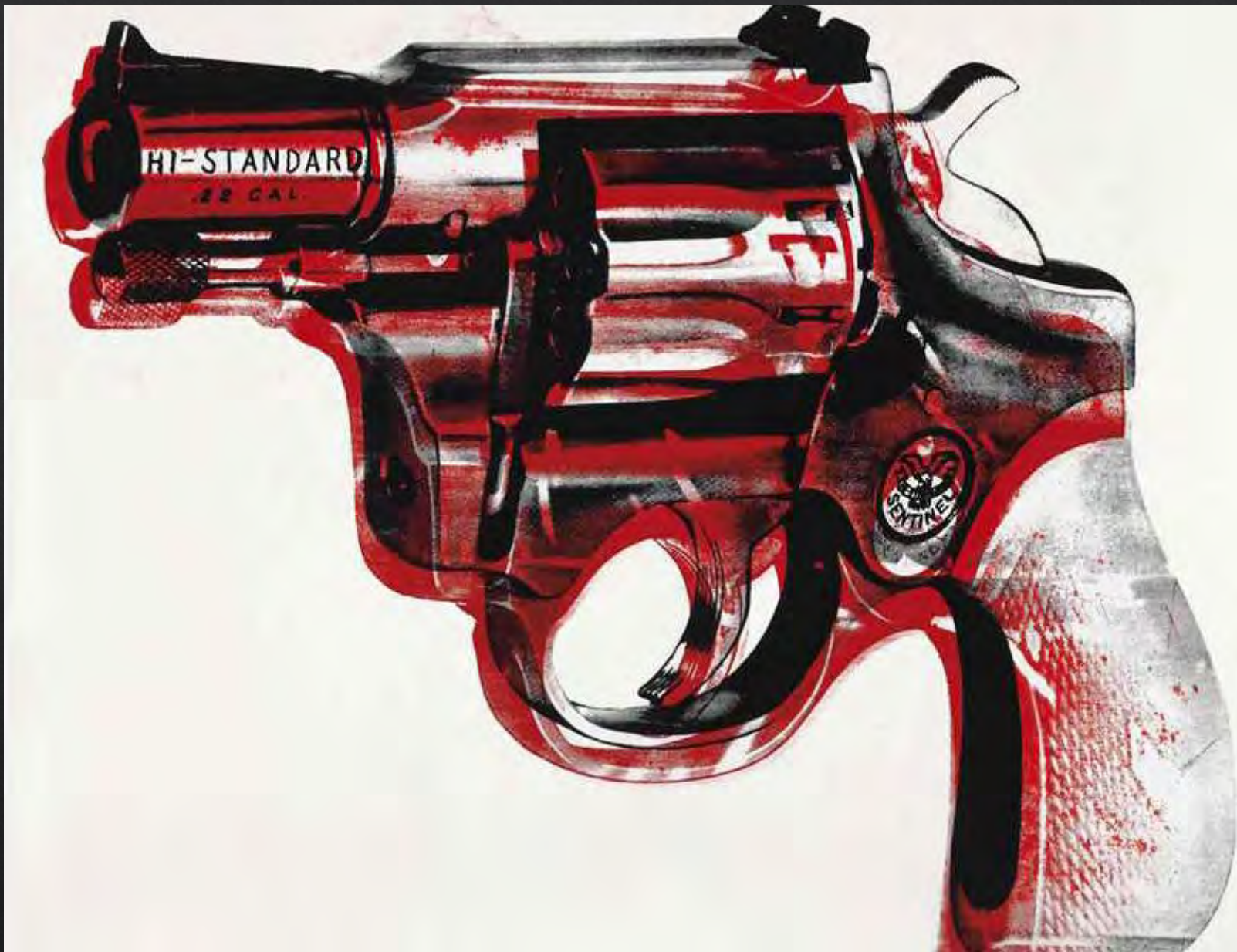
Andy WARHOL, Gun , 1982, 178x229 cm, sérigraphie et acrylique sur toile