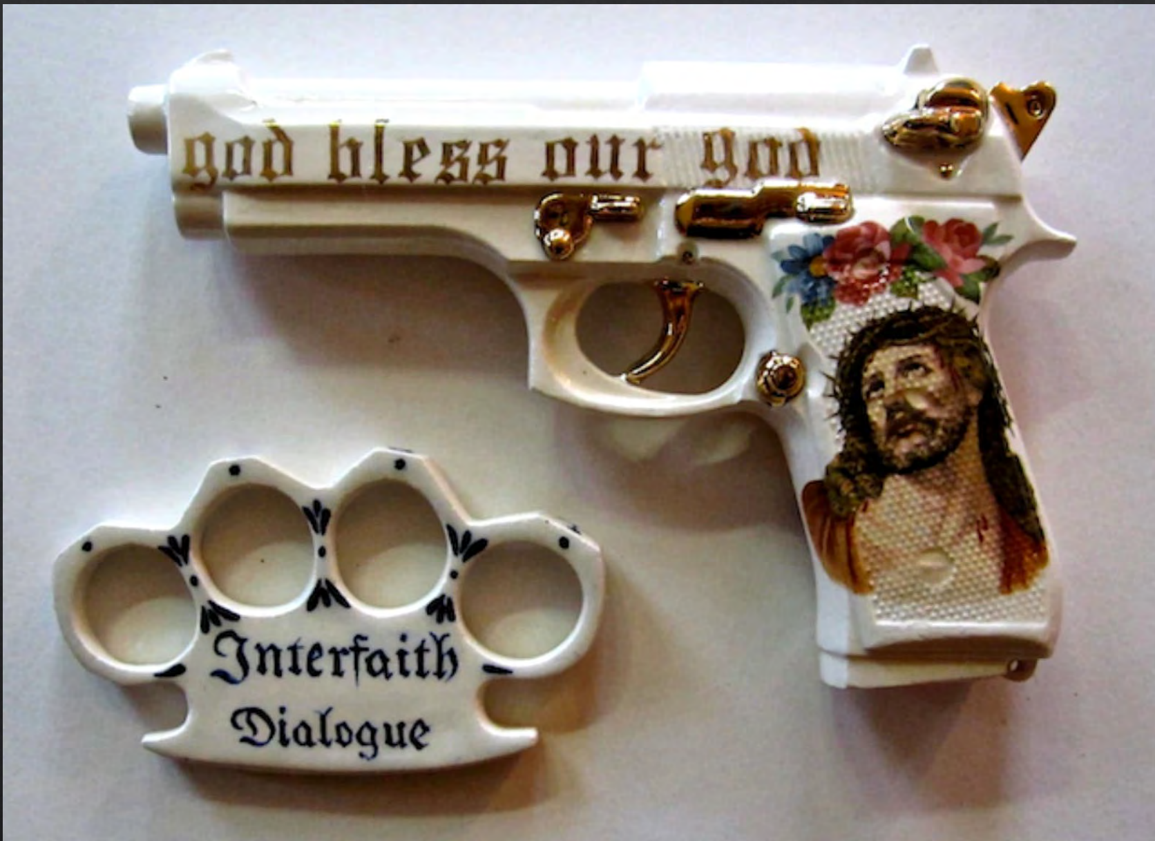
Charles KRAFFT, San Jose Beretta , 2017, 21,1x13,7x3,8 cm, porcelaine