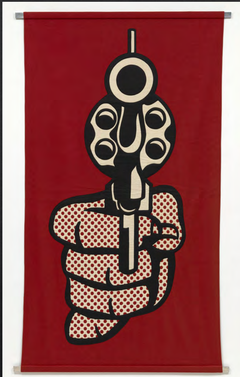
Roy LICHTENSTEIN, Pistol , 1964, 208x124 cm, bannière en feutre