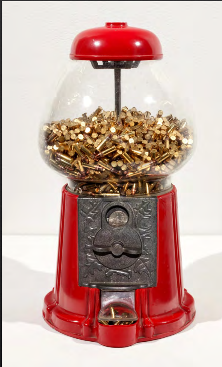
Generic Art Solutions, Target: Audience , 2014, 36x20x20 cm, distributeur de chewing-gum, 2000 munitions