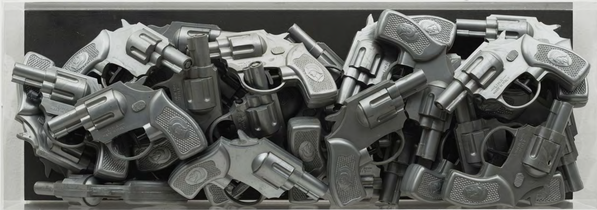
ARMAN, Boum Boum ça fait mal , 1960, 30x80x10 cm, pistolets à eau en plastique, boîte plexiglas