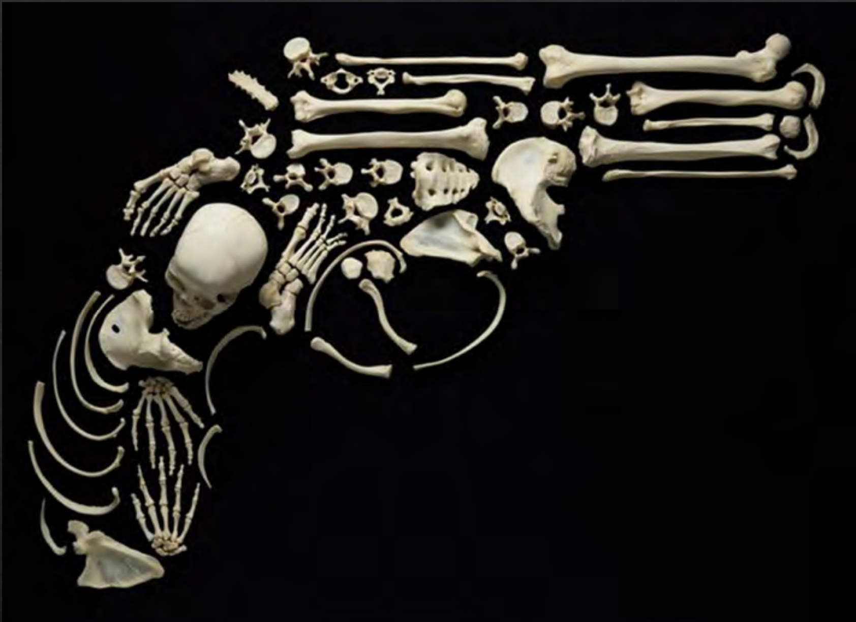
François ROBERT, Stop The Violence: Gun , 2012, photographie