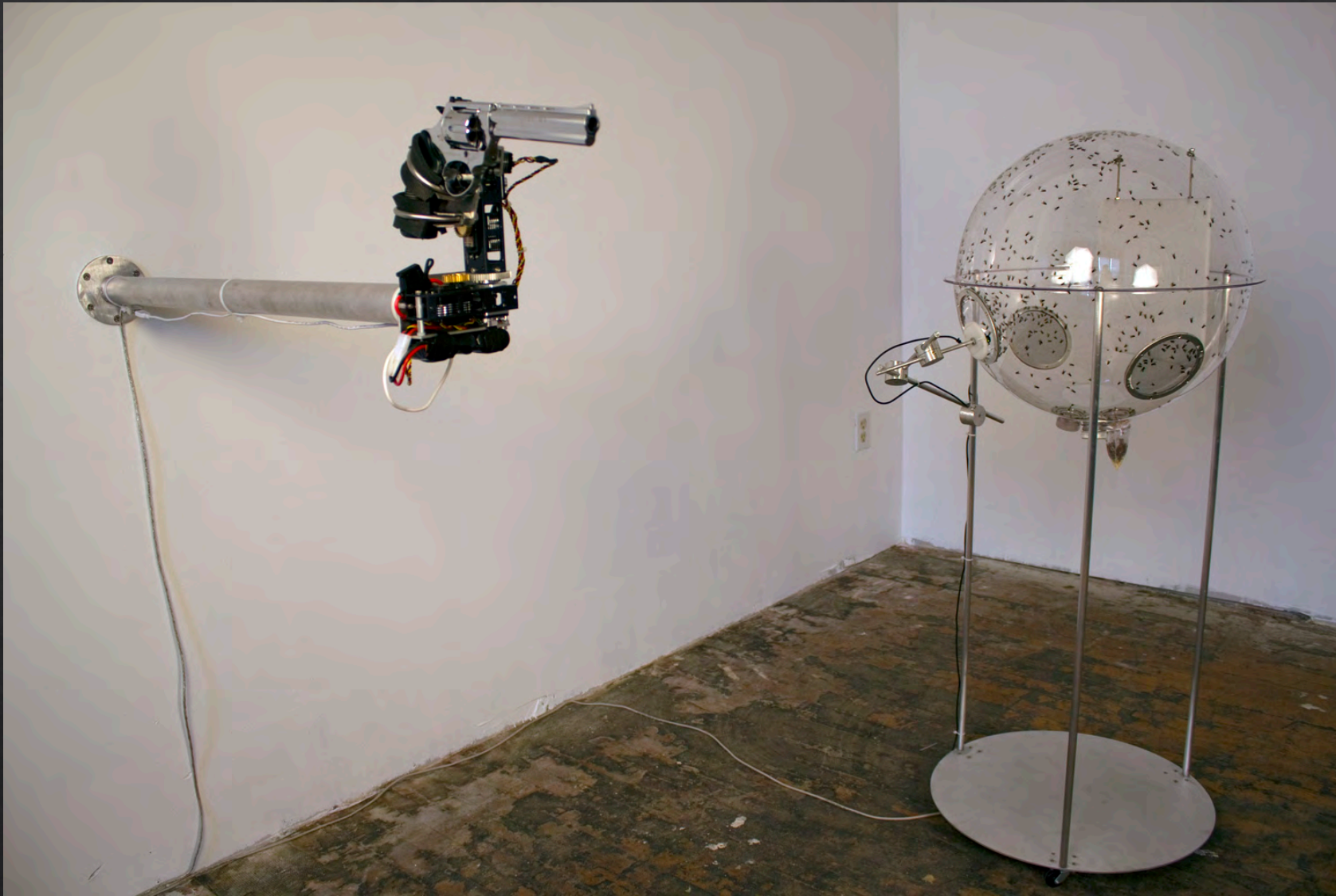
David BOWEN, Fly Revolver , 2018, dimensions variables, installation intercative