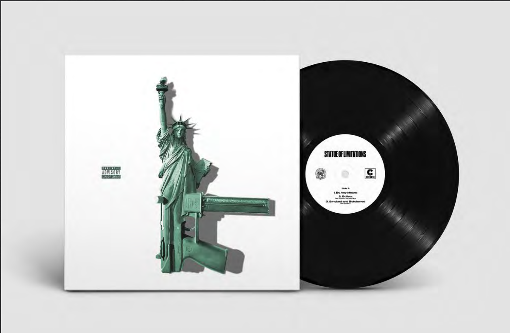
Smoke DZA, 2019, album Drug Rap