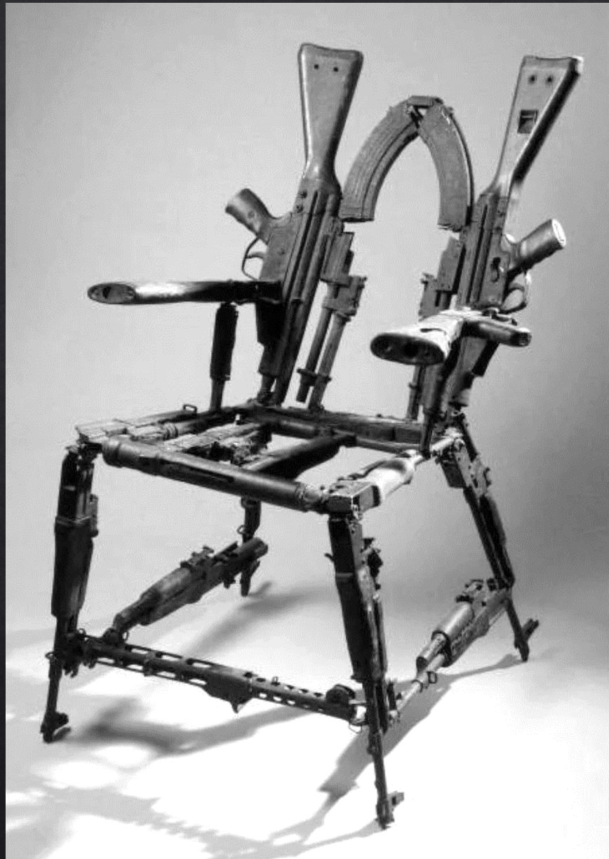
Cristovao CANHAVATO, Throne of Weapons , 2001, 61x61x101 cm, armes désaffectées