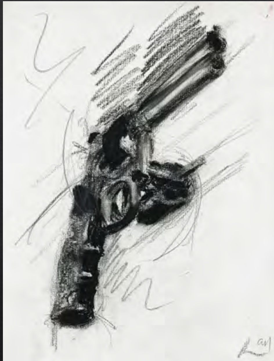
Robert LONGO, Gun , 1994, 30x23 cm, graphite et fusain sur papier