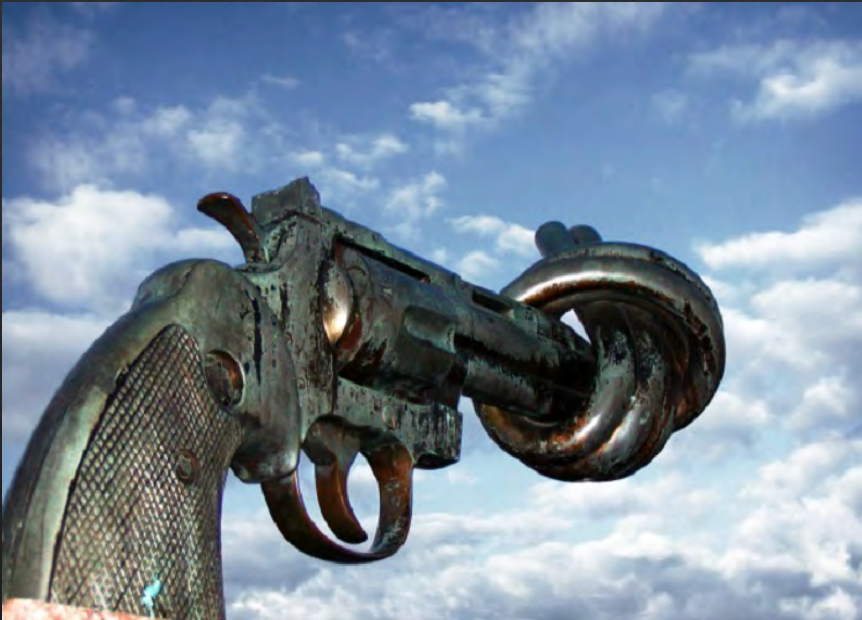
Carl Fredrik REUTERSWÄRD, Non-violence , 2003, 150 cm de haut, bronze (inspiré de l'assassinat de John Lennon)