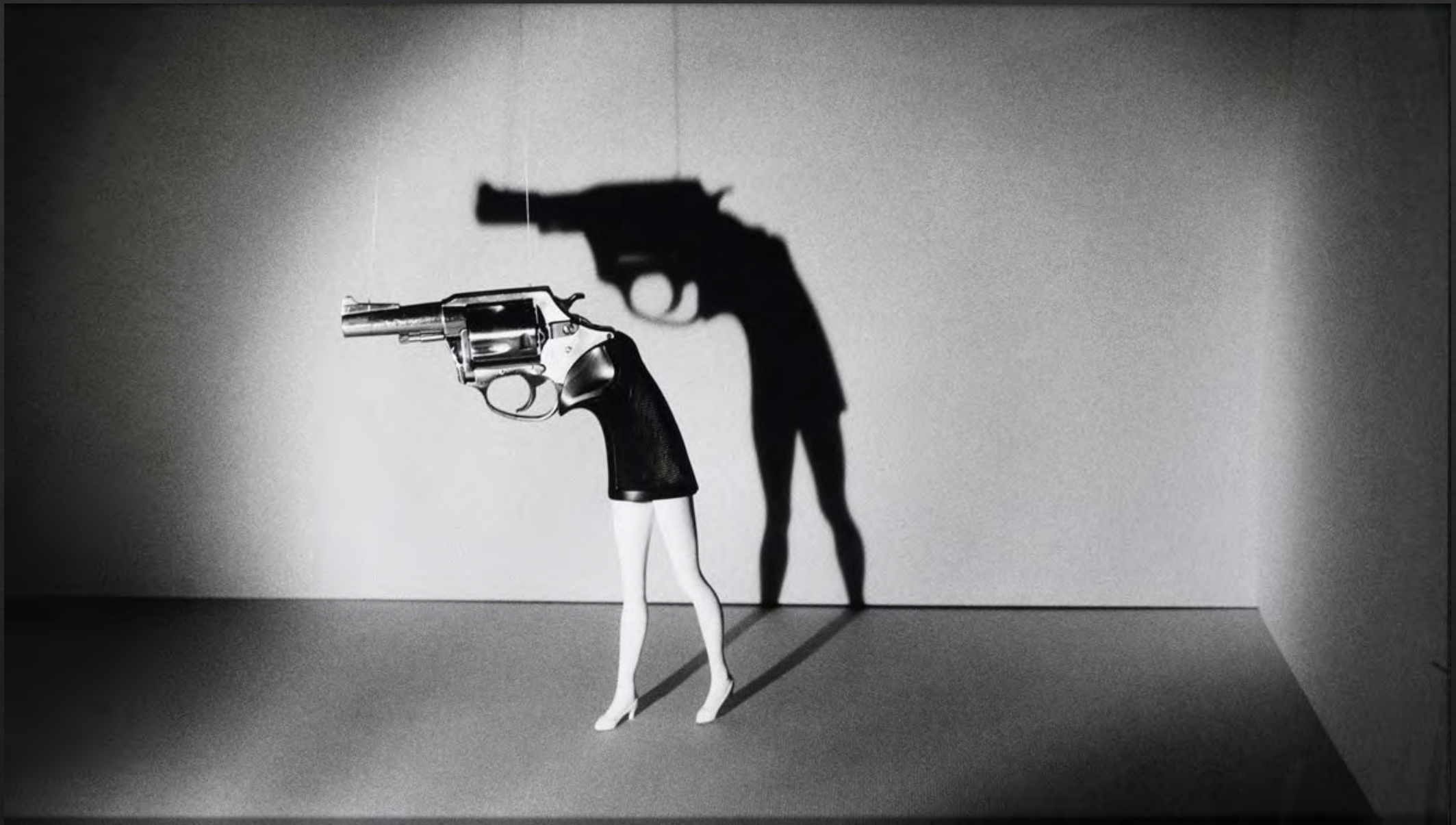
Laurie SIMMONS, Walking Gun , 1991, photographie